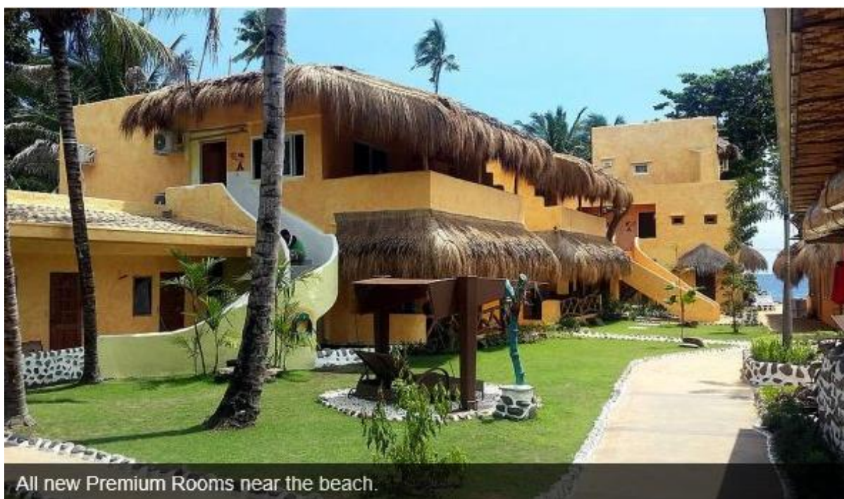
All new Premium Rooms near the beach.

Pokoje Premium są luksusowo wyposażone. Są 4 kategorie Premium: Regular, Seaview, Seaview z jacuzzi i Premium w prywatnym ogrodem (te można zarezerwować jako pokoje Family). Pokoje Deluxe i Premium położone są w pobliżu plaży. Do dyspozycji gości jest restauracja na plaży, bar przy basenie (otwarty 24 godziny na dobę). Na życzenie klientów przy basenie możliwe jest wyświetlanie na dużym ekranie filmów (zarówno fabularnych jak i tych spod wody) i wydarzeń