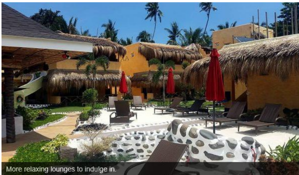
More relaxing lounges to indulge in.